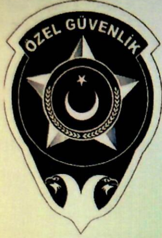
EK-9/A ÖZEL GÜVENLİK YILDIZI ARMASI